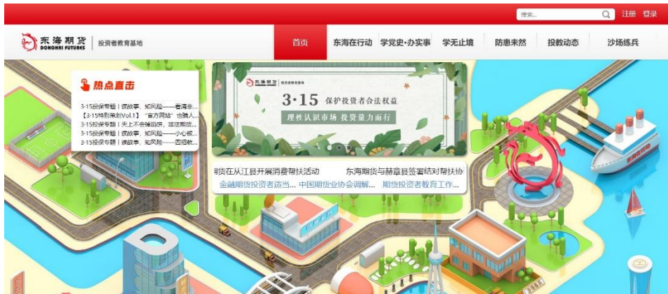
图 4 在投教基地网站投放 3·15 宣传图片