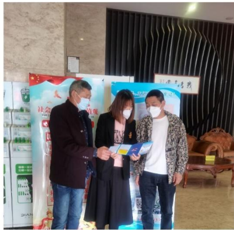
图 8 对中小投资者开展宣传教育