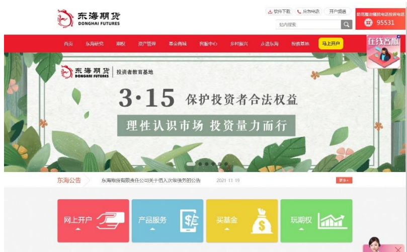
图2 “每日一宣”活动海报

指导单位：中国证监会江苏监管局 主办单位：江苏省上市公司协会 江苏省证券业协会 江苏省期货业协会 江苏省投资基金业协会 制作单位：东海期货有限责任公司