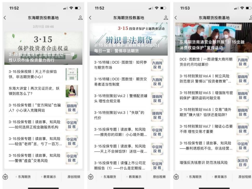
图 5 在投教基地公众号投放 3·15 投教产品