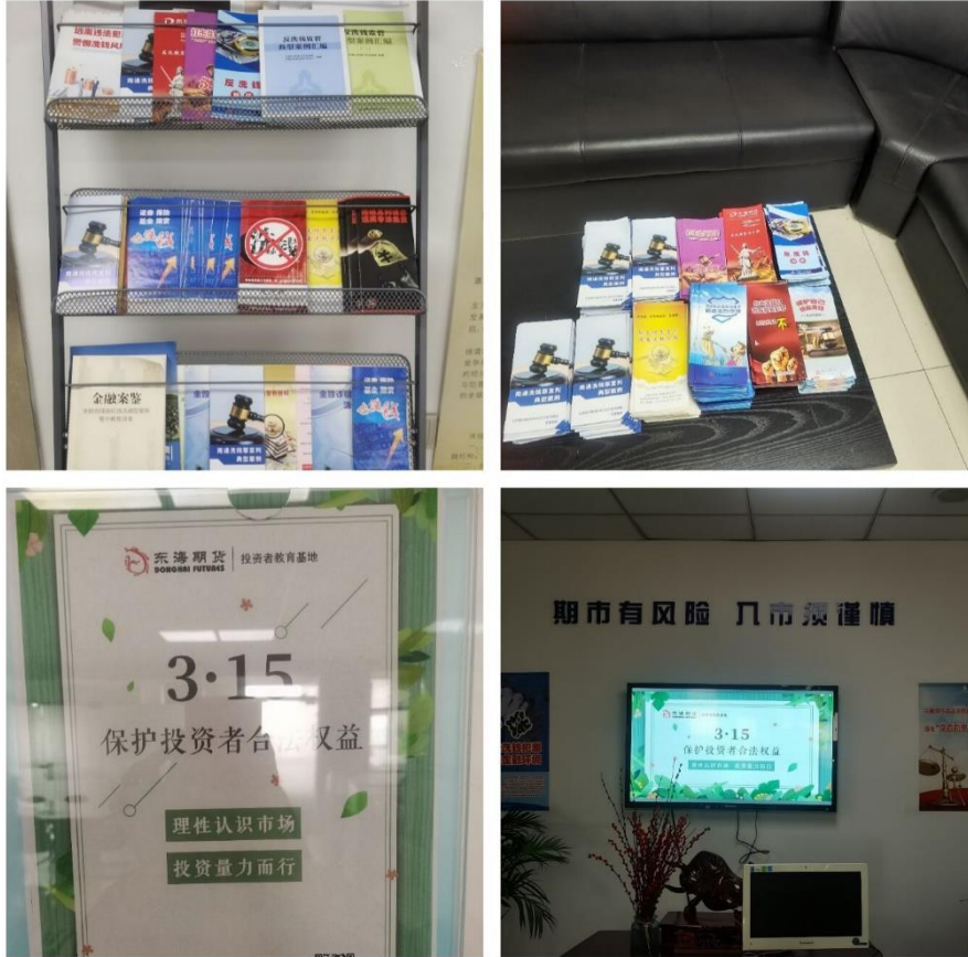
图 7 在营业场所展示宣传内容