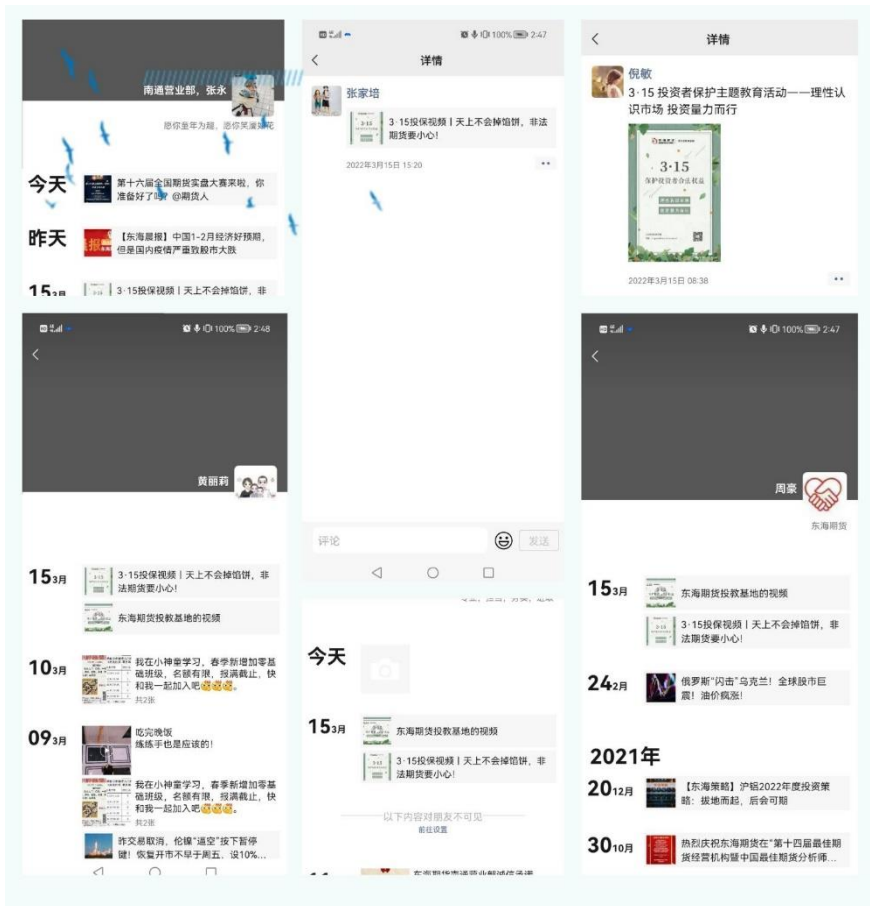
图 6 公司员工积极转发